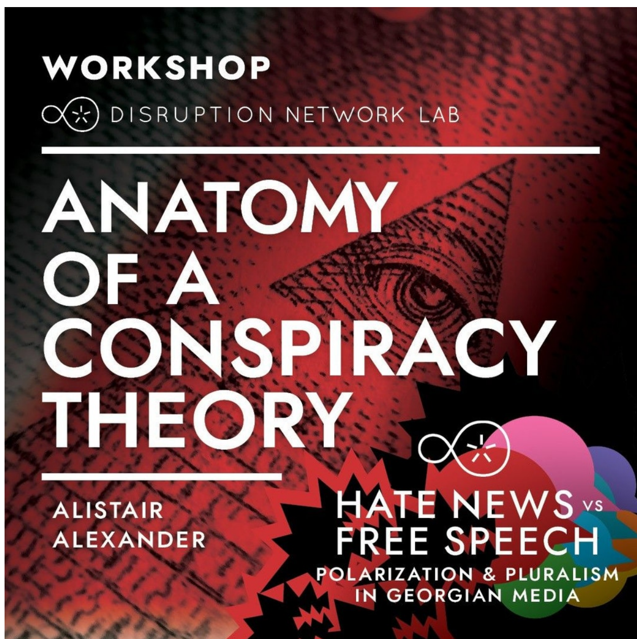
The poster.

I think many of us watched in awe when President Trump's tweets related to the election results appeared with a warning-type notice from Twitter. I am not from the United States so it's difficult for me to say whether Twitter flagging the president's posts is a good thing for American democracy or not, but from the reactions I've seen, many seemed entertained. We need to be wary, however, that what makes sense in one context may not make sense in another. I don't know if anyone believes that Twitter should now roll out this policy globally and start flagging election-related tweets that may be considered disputed. During the conference we will debate this with our experts as well.